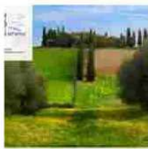
Dal Paziente inglese al Gladiatore, da Romeo e Giulietta a Nostalgia: passeggiata cinematografica n...