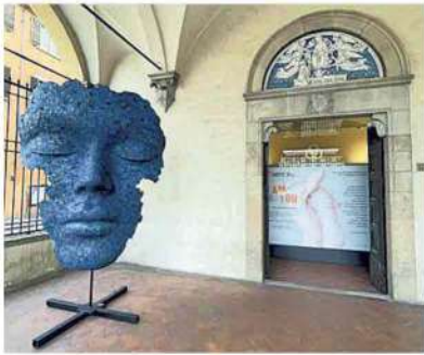
▲ Florence Biennale Al via la mostra