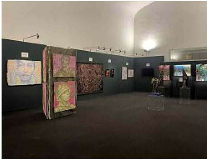
Accademia del disegno Alcune delle opere in mostra