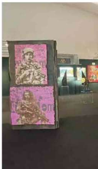
Alcune delle opere esposte