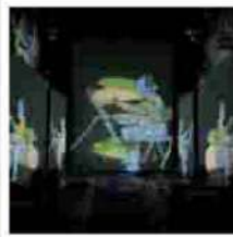
Omaggio alla grande bellezza: immagini da Monet Experience dove l'arte incontra la tecnologia