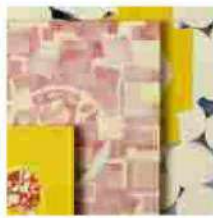
Mehr Licht (più luce): s'inaugura sabato 19 marzo alla Galleria Poggiali di Firenze la mostra di Dom...