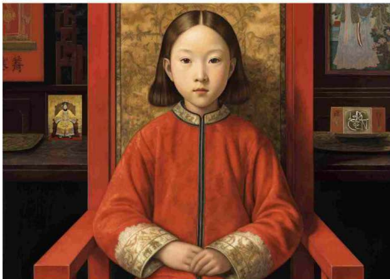
The Last Empress

A ottobre 2023 si è svolta presso la Fortezza da