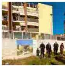
PNRR (Piano nazionale di ripresa e resilienza): a Livorno arrivano 13,7 milioni di euro per riqualif...